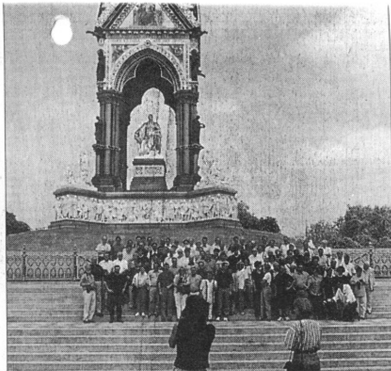
Die Reisegruppe der Sänger aus Niederzeuzheim und Ebernahn vor dem St. Alberts-Denkmal an der St. Albert-Hall.

Über den Wettbewerb hinaus wurde der Gruppe auch ein interessantes Programm geboten. Neben dem Besuch von Schloß Windsor, dem Wohnsitz der königlichen Familie, wurden die Städte Chester und London besichtigt.