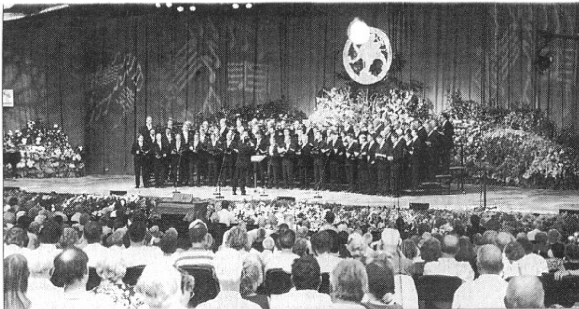
Der MGV „Liederkranz“ Niederzeuzheim/Ebernahn beim Auftritt während des Chorfestivals in Llangollen in Wales.